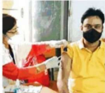
टीका लगवाता स्वयंसेवक ● नईदुनिया

टीका को लेकर फैले भ्रम को लोगों के मन से दूर करके उन्हें वैक्सिन लगवाने के लिए प्रेरित करने के उद्देश्य से अटल विहारी वाजपेयी विश्वविद्यालय विलासपुर से संबद्ध शासकीय निरंजन केशरवानी महाविद्यालय कोटा की राष्ट्रीय सेवा योजना इकाई के स्वयंसेवकों के द्वारा शत-प्रतिशत टीकाकरण एवं जागरूकता अभियान चलाया जा रहा है। इसके अंतर्गत पीओ शिष्य जैन